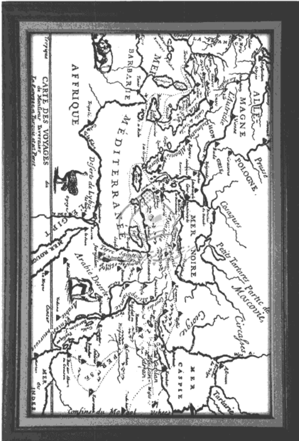
خريطة رحلات المؤلف في الشرق الأدنى (منقولة عن رحلته، بالأصل الفرنسي)